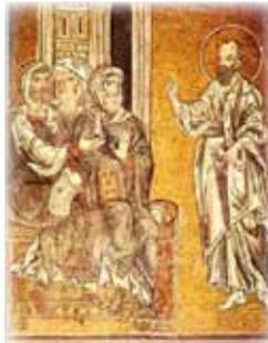
Gesù entrò nel tempio, gli si avvicinarono ciechi e storpi e li guarì.